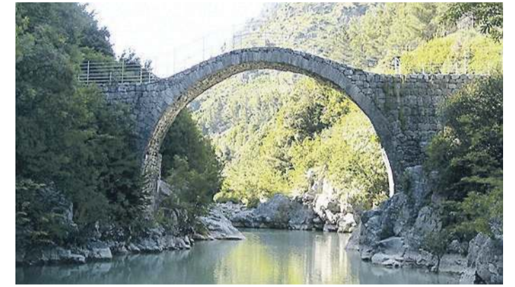
CUSANO MUTRI Il ponte di Annibale di epoca romana